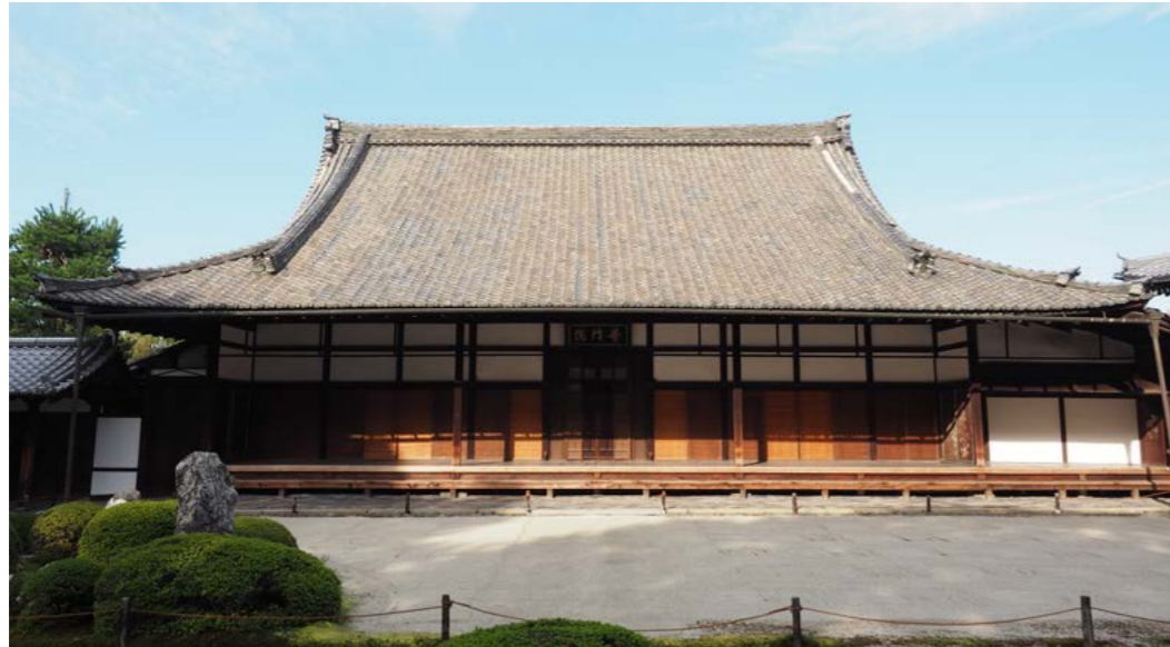
常楽庵客殿(普門院) 修理前外観